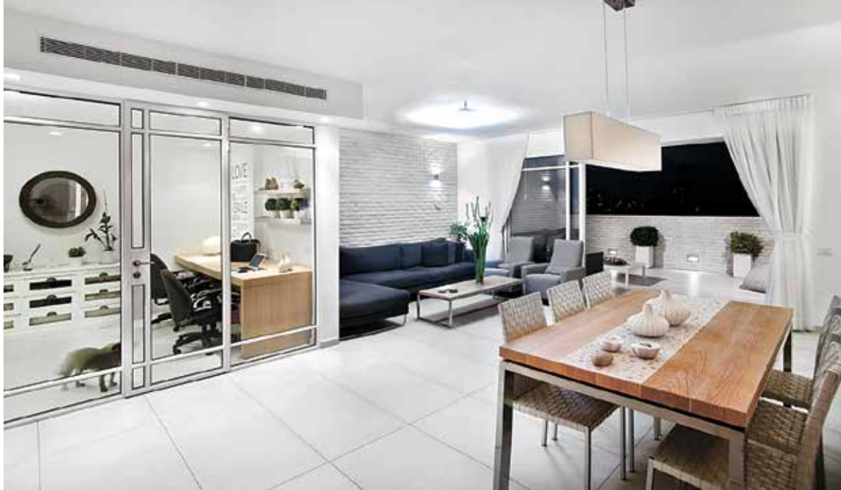
בחלל הציבורי של הבית תוכננה פינת עבודה באופן שיוצר הפרדה בין העבודה לבין חיי המשפחה. אדריכלות איריס אבנרי דביר

בחדר האוכל, האדריכלים מדגישים כי יש לבחור בחומרים - כדוגמת קירות זכוכית - שלא יגרמו לתחושה סגורה. "יש להתייחס לנושא האקוסטיקה ולעבוד עם חומרים שיאטמו לה" לוטין את החלל כך שהדעת לא תוסה ובמידת הצורך, ניתן לסגור את קירות הזכוכית עם וילון", אומרת אבנרי דביר. בכל שינוי דירתי צריך לקחת בחשבון ששינויי אינסטלציה, חיוטי חשמל ומערכות נוספות במסגרת הקיים אינם מצריכים אישור יועצים, ובהתאם אפשר לנצל את המטראז' הקיים מבלי להיכנס לתהליכים ביוורקטיים מול הרשויות. "כל עוד אין חריגה מהגבולות שאושרו על ידי הרשויות אין דרישה לקבלת היתר", מדגישה וינברן. "זה מייחד את הצורך באנשים מקצוע שתפקידם לחתום על ההיתרים ולאשר שינויים מורכבים, ואפשר פשוט להיעזר בשירותיהם של חשמלאי או אינסטלטור מוסמך ומורשה שיבצעו את ההתאמות לתוואי הפנימי החדש".